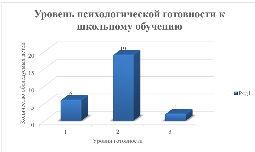
Диаграмма № 1.

Исходя из выше представленных данных, можно сделать вывод, что интегральные показатели уровней психологической готовности к школьному обучению у детей подготовительной группы распределились следующим образом: высокий уровень - 6 детей (22%), средний уровень 19 ребёнок (71%) и низкий уровень 2-е детей (7%) (диаграмма № 1).